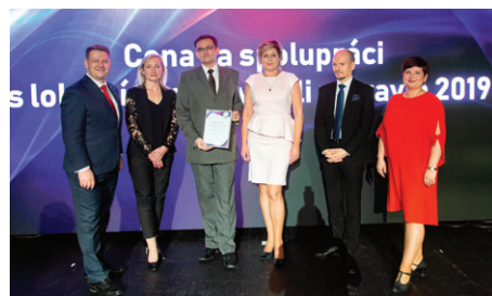
Zástupci družstva KONZUM při slavnostním předávání ocenění.